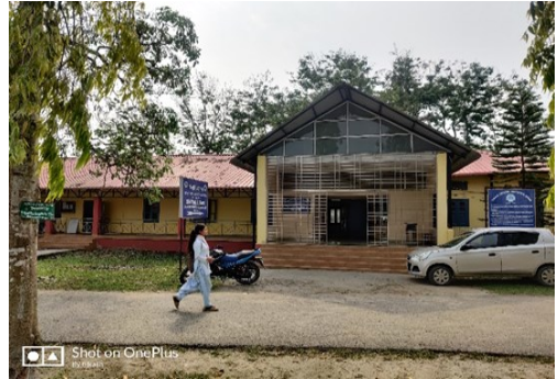
শুৱালকুছি বৃদৰাম মাধৱ সত্ৰাধিকাৰ মহাবিদ্যালয়