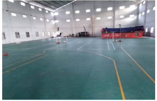
দেৰগাঁও কমল দুৰৰা মহাবিদ্যালয়