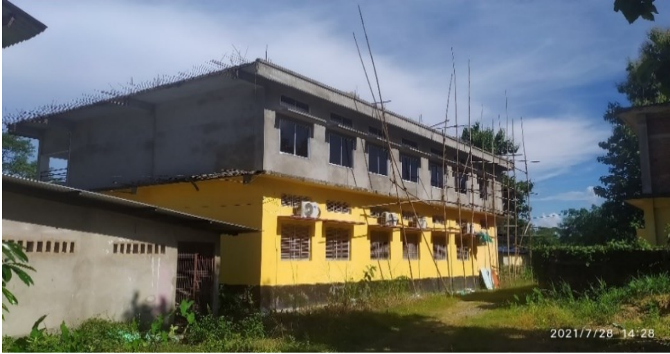
যোগানন্দ দেৱ সত্ৰাধিকাৰ গোস্বামী মহাবিদ্যালয়

কামৰূপ (গ্ৰাম্য) জিলাৰ শৈক্ষিক আন্তঃগাঠনিত ৰুচা ১.০ ৰ প্ৰভাৱ: