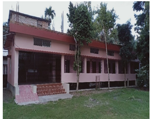
সুৰেন দাস মহাবিদ্যালয়