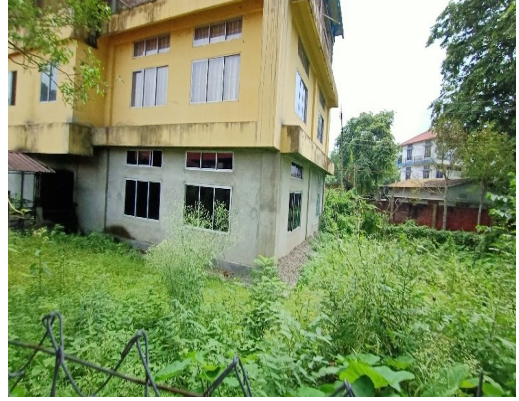
গোলাঘাট বাণিজ্য মহাবিদ্যালয়