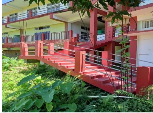
জয়া গঙ্গে মহাবিদ্যালয়