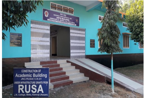
জৱাহৰলাল নেহৰু মহাবিদ্যালয়

(প্ৰজ্ঞাৰ এপ্ৰিল-জুন, ২০২০ সংখ্যাত প্ৰকাশিত)