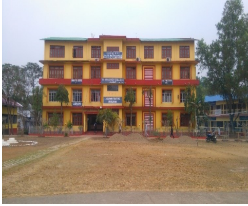
দেবরাজ বয় মহাবিদ্যালয়