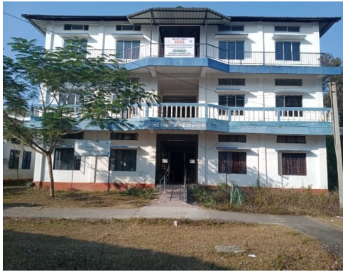
হেমপ্রভা বববরা ছোরালী মহাবিদ্যালয়