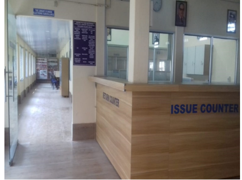
পূব কামৰূপ মহাবিদ্যালয়