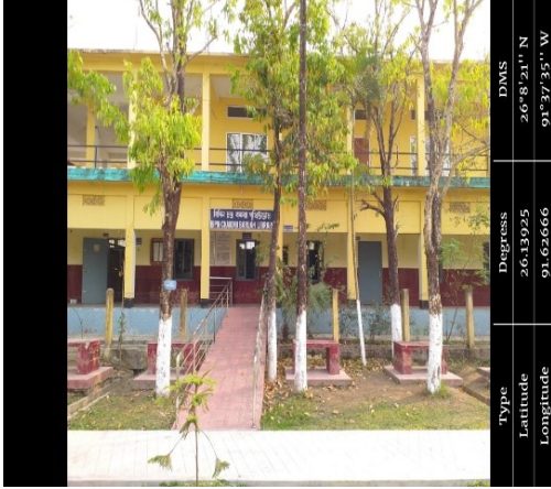
পশ্চিম গুৱাহাটী মহাবিদ্যালয়