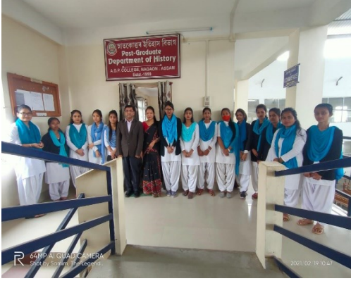
আনন্দৰাম টেকিয়াল ফুকন মহাবিদ্যালয়